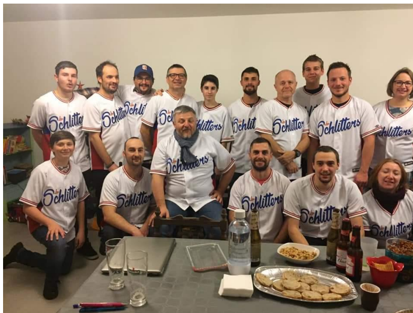
L'équipe lors de la remise des nouveaux maillots - Déc 2019

A ce jour, le club compte 26 licenciés, dont 3 moins de 18 ans, 4 femmes, 19 hommes.